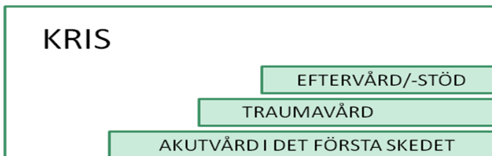
Figur 1. De olika vårdstegen vid konstaterat våld.